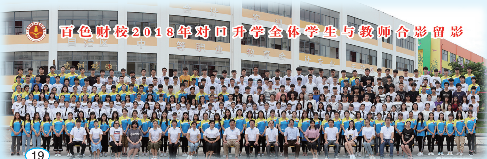
百色财校2018年对口升学全体学生与教师合影留念